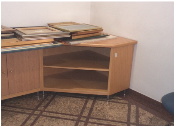
Slika broj 1-5 -Inventarni broj 60