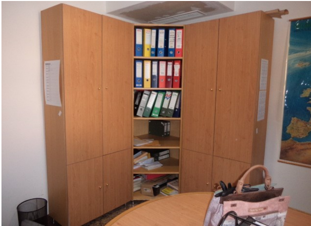
Slika broj 1-1 -Inventarni broj 56 i 194