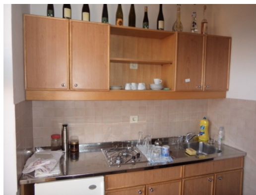
Slika broj 1-8 -Inventarni broj 62