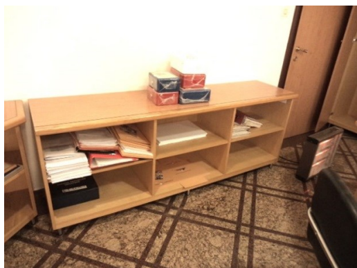
Slika broj 1-9 -Inventarni broj 61