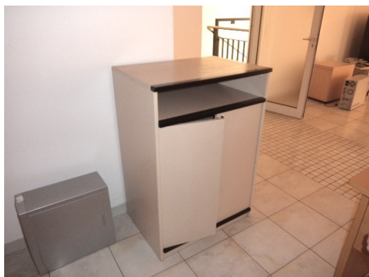
Slika broj 1-11 -Inventarni broj 338