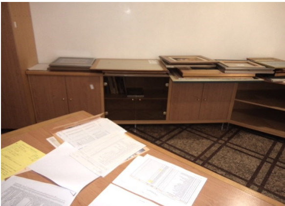
Slika broj 1-3 -Inventarni broj 58