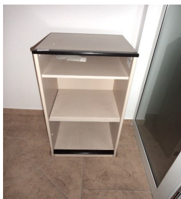
Slika broj 1-13 -Inventarni broj 352