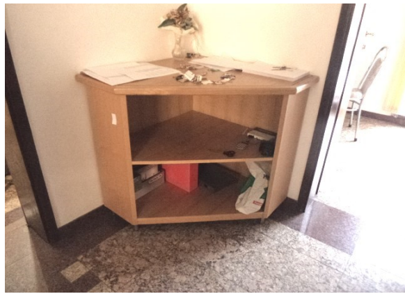
Slika broj 1-4 -Inventarni broj 59