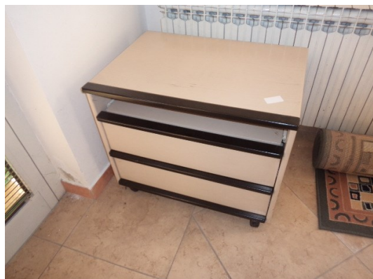
Slika broj 1-14 -Inventarni broj 353