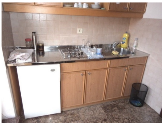
Slika broj 1-7 -Inventarni broj 62 i 227