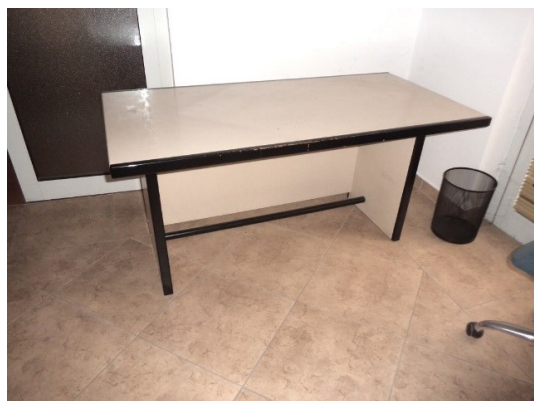
Slika broj 1-12 -Inventarni broj 339