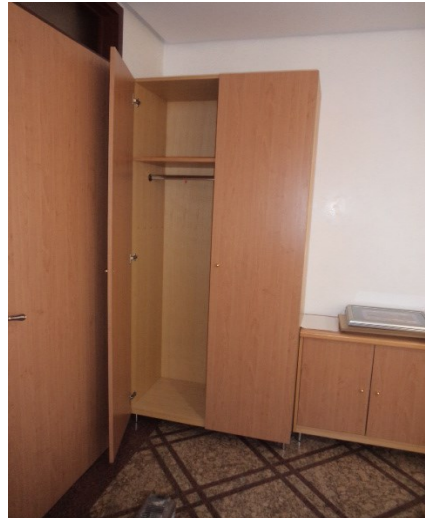
Slika broj 1-2 -Inventarni broj 57