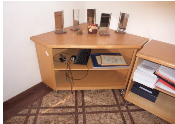
Slika broj 1-6 -Inventarni broj 60